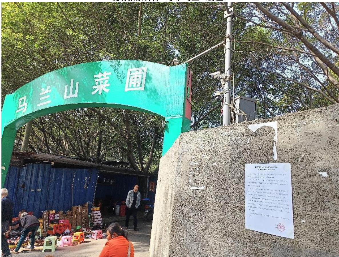
现场张贴公告（马兰山菜圃）