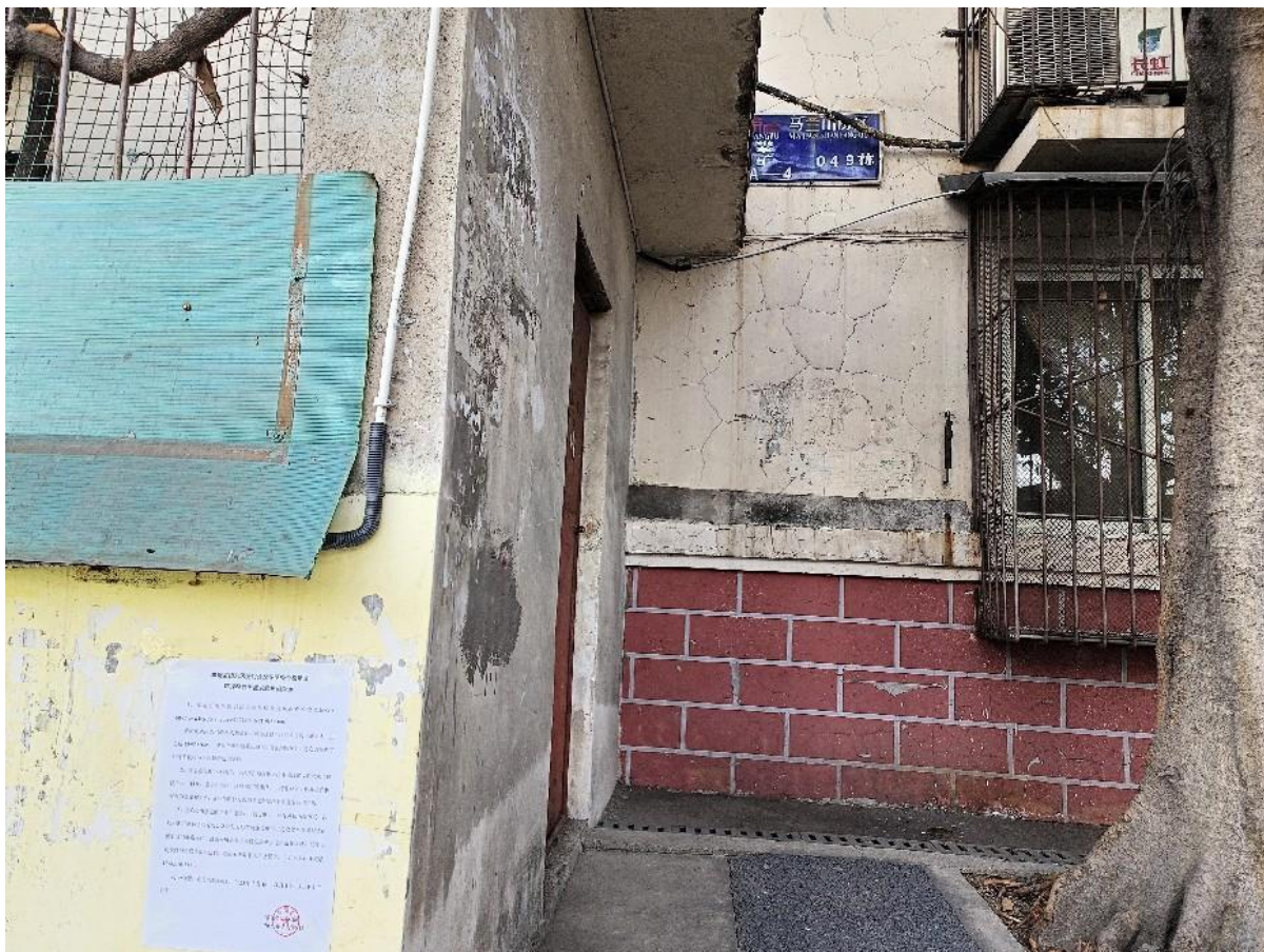
现场张贴公告（攀矿马兰山房区）