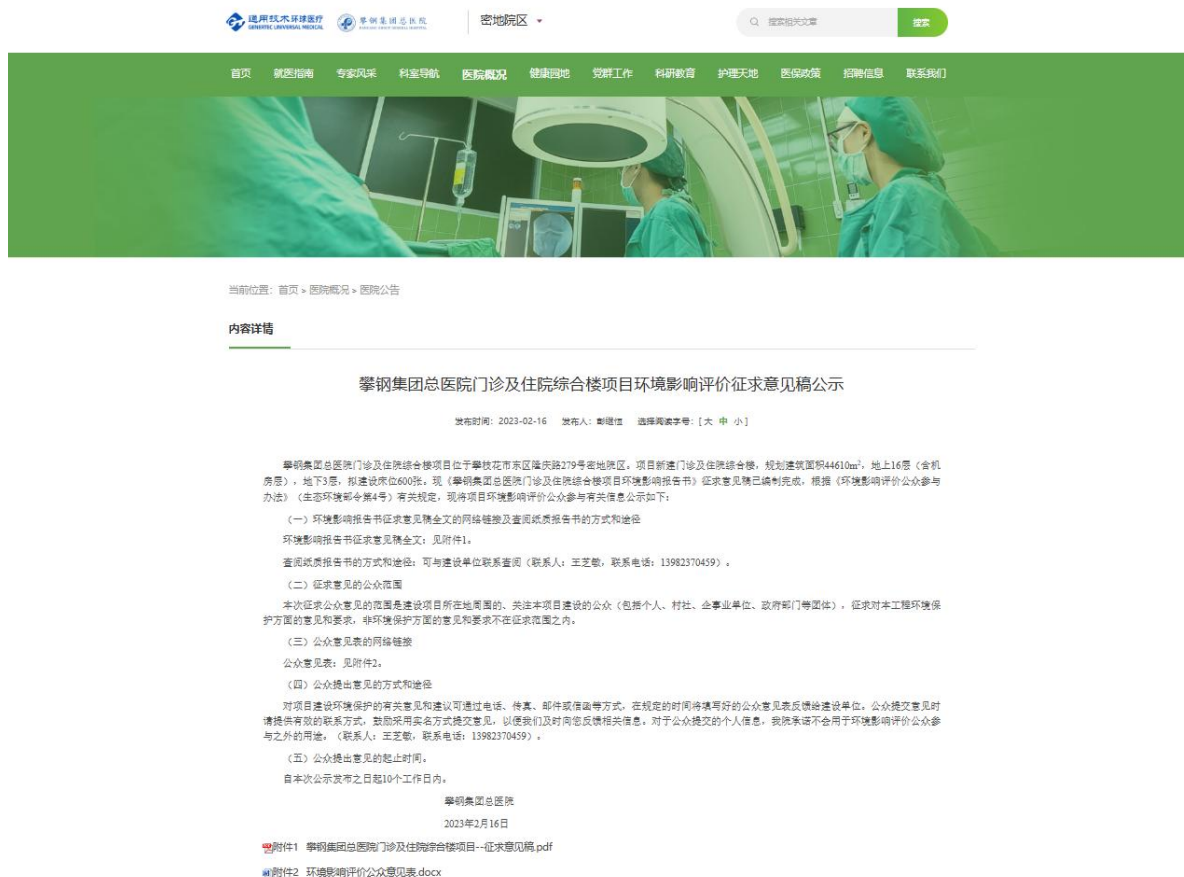
图 3.2-1 第二次网络公示截图

项目第二次公示采取网络平台公开方式, 在攀钢集团总医院官网(网址: http://www.hqylpgzyy.com/c/2023-02-16/711911.shtml )进行公示, 公示期 10 个工作日。第二次网络公示截图如下: