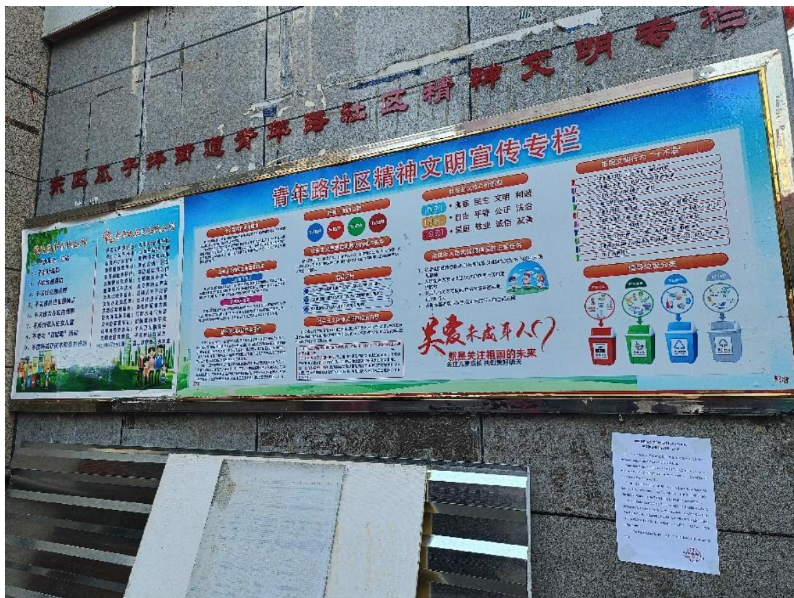
现场张贴公告（青年路社区）