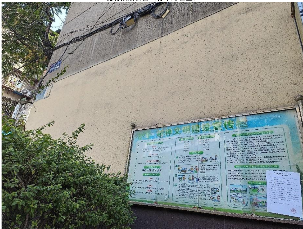
现场张贴公告（攀矿瓜子坪房区）