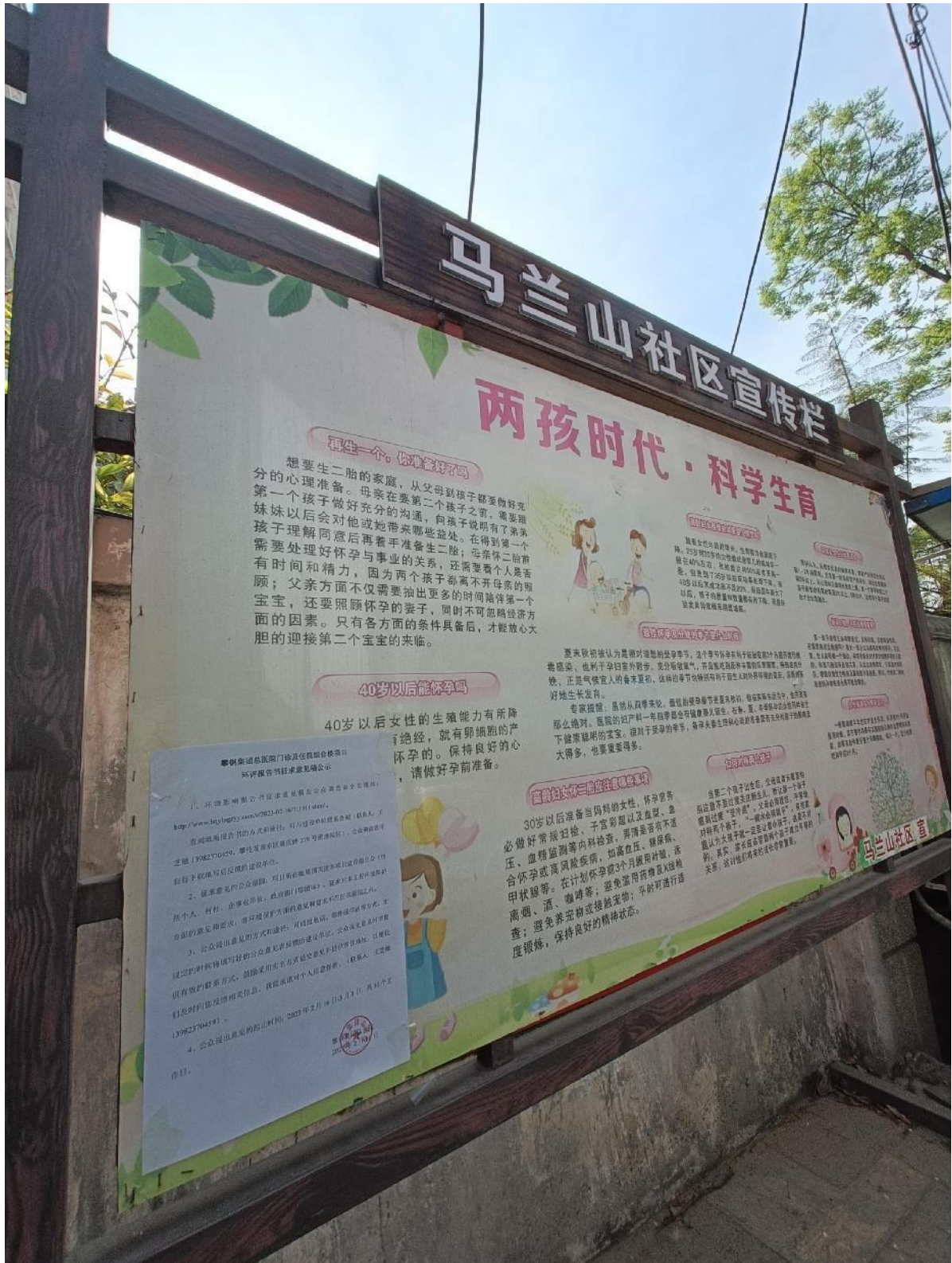
现场张贴公告（马兰山社区）