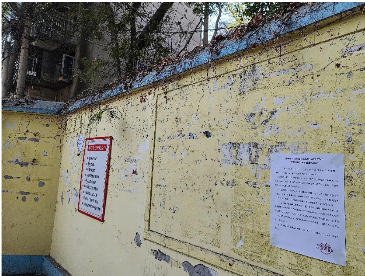
现场张贴公告（攀矿马兰山房区）