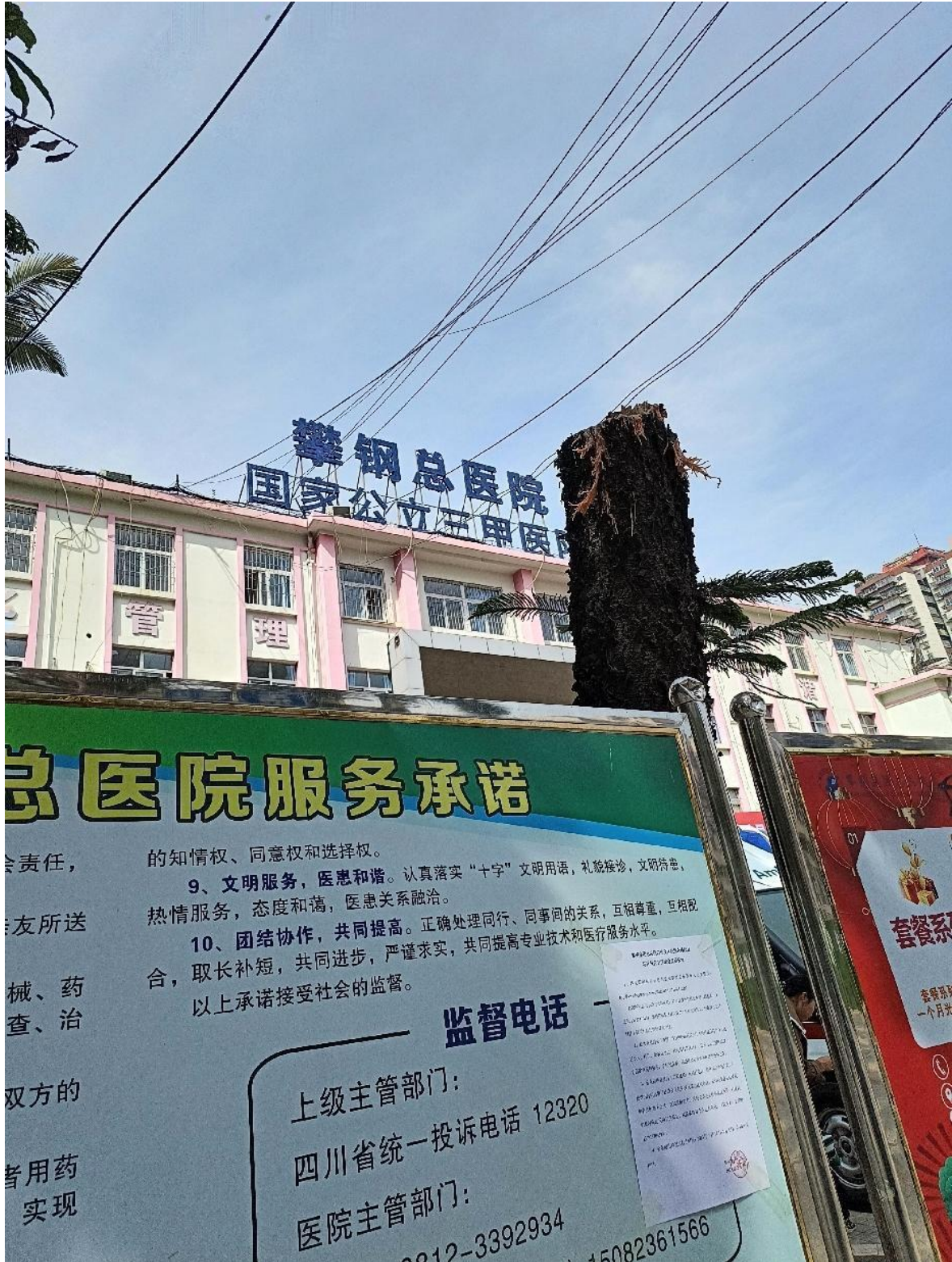
现场张贴公告（密地院区）