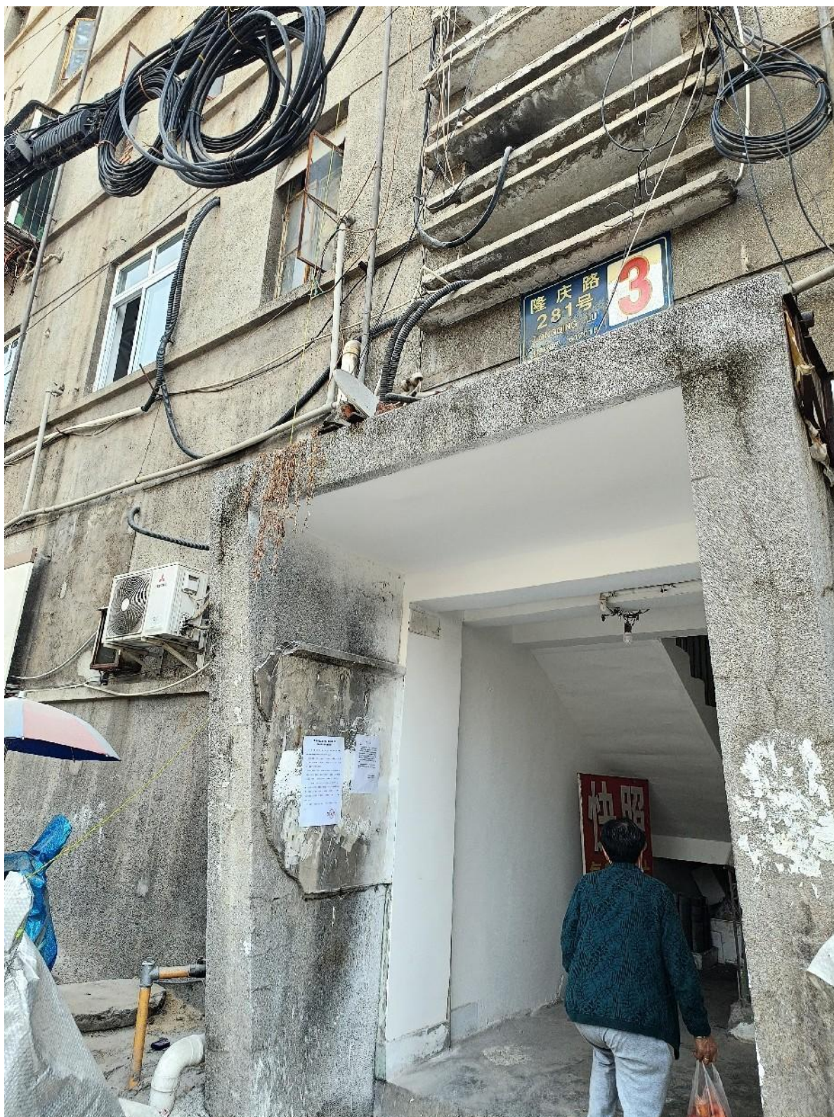
现场张贴公告（隆庆路 281 号住房楼）