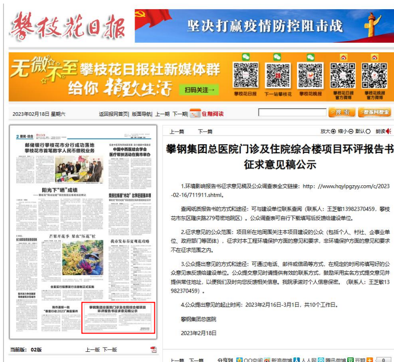
图 3.2-2 攀枝花日报公告截图（2022 年 2 月 18 日）