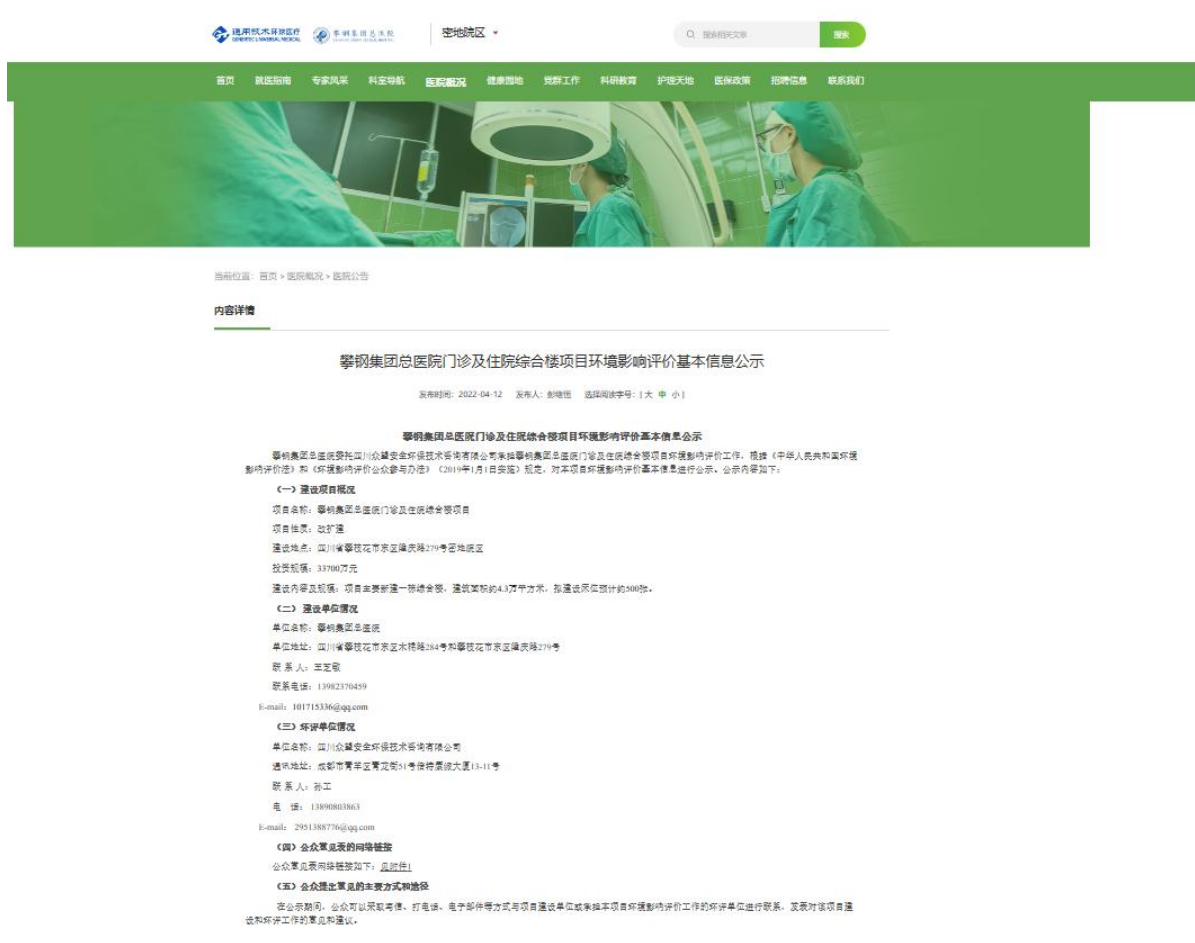
图 2.2-1 第一次网络公示截图