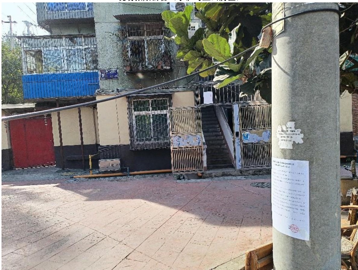
现场张贴公告（攀矿马兰山房区）