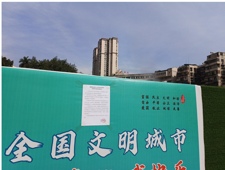
现场张贴公告（项目建设区）