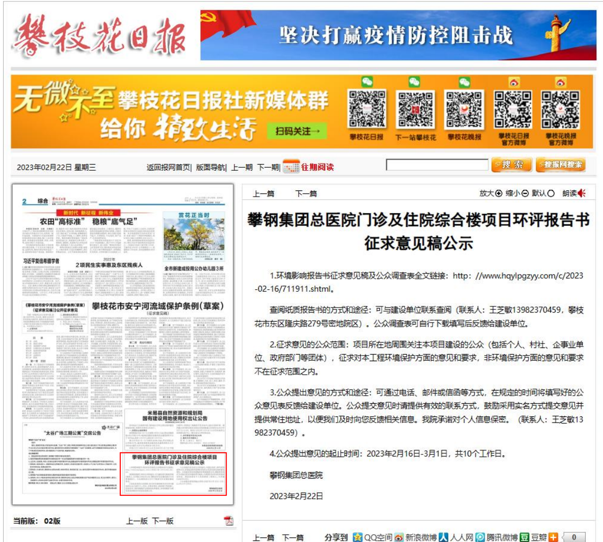
图 3.2-3 攀枝花日报公告截图（2023 年 2 月 22 日）